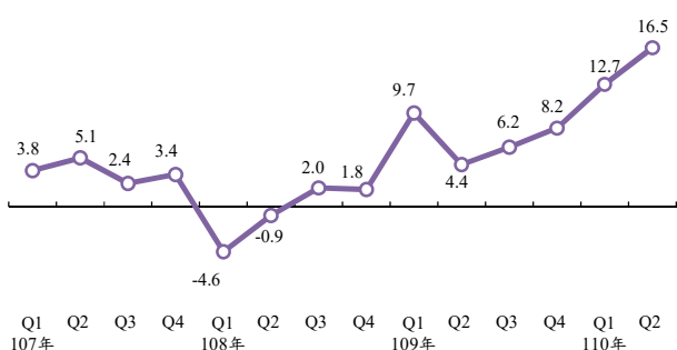
工業生產指數年增率(%)